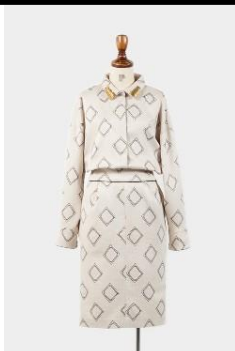
【archi】 HEMEL ONE PIECE ¥33,600 (税込)