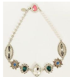
【joujou】 CLAIRE NECKLACE ¥11,550 (税込)