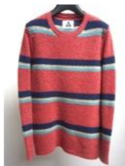
【ARIA】 AGATA KNIT ¥27,300 (税込)