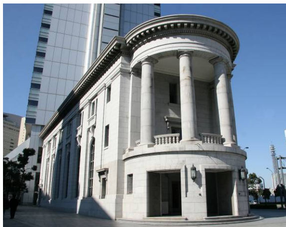
< 外観 >