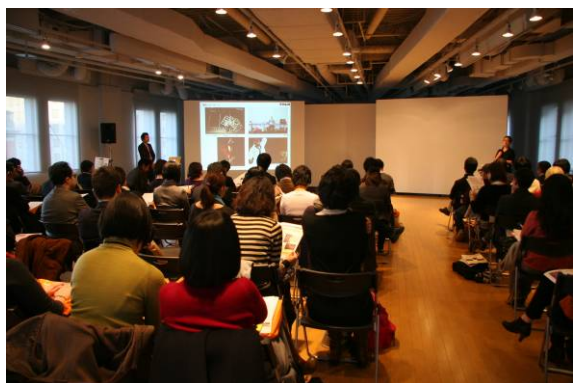
< 3 F >