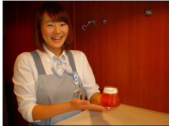
富士山グラスによる生ビールのご提供