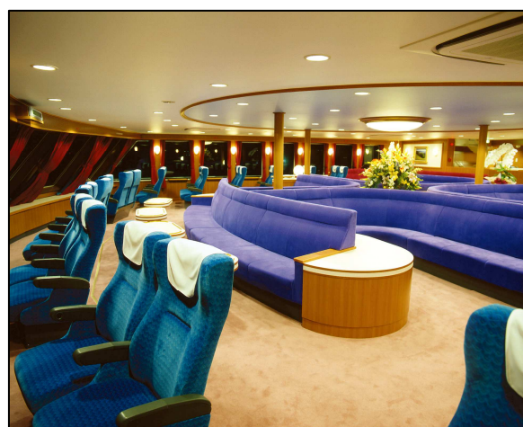
駿河湾フェリー特別室