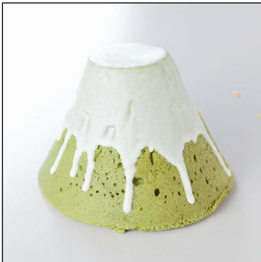
富士山メロンパン