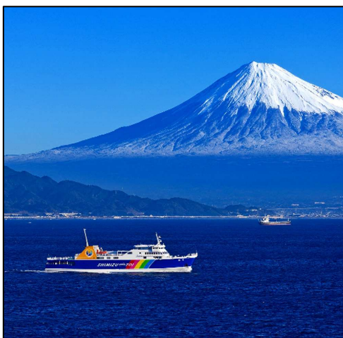
駿河湾フェリーと富士山