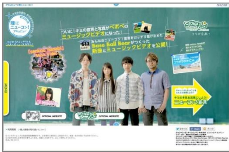
BBBのニューコンソング

「senkou_hanabi」は、10代のミュージシャンだけが参加できる音楽の甲子園「閃光ライオット2013」の公式応援ソングとなり、完成されたミュージックビデオは、8月4日(日)に日比谷野外音楽堂で開催された「閃光ライオット2013」ファイナルで初上映されました。8月5日(月)より、本サイトでも公開中です。