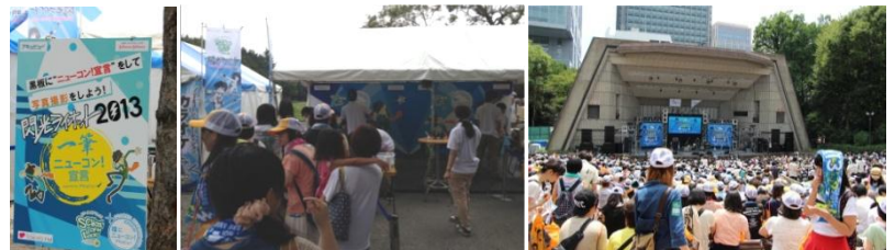
「アキュビュー」ブースには、黒板が登場。 当日もたくさんの“ニューコン！宣言”が集まりました。