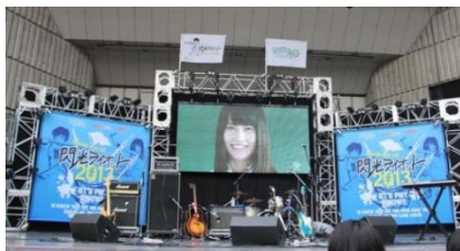
「閃光ライオット」ファイナルの様子