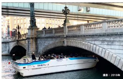
日本橋クルーズ(イメージ)