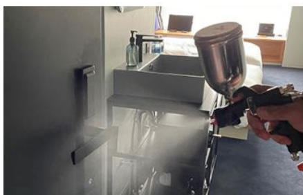
客室内の消毒と抗菌対策の徹底