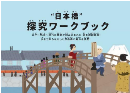
日本橋探求キット(日本橋探究ワークブック)

キット付属の探究ワークブックに街歩きで気付いたことをまとめ、日本橋探究マップに貼り付けると自由研究が完成します。都内から遠方へのお出かけが難しい中、マイクロツーリズムとしても満喫しながら、ご家族だけで完成することのできる「親子合宿旅」を提案いたします。