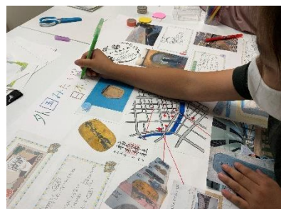
日本橋探究キット(A1 サイズ日本橋探究マップ)

14:00 ホテルに戻って荷物を受け取って、帰宅 ご自宅に帰って“日本橋探究ワークブック”を切り取り“探究マップ”に貼り付けたら、オリジナルの自由研究が完成です！