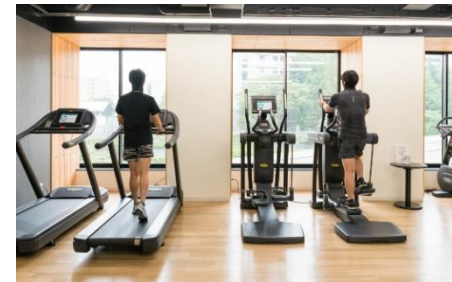
フィットネスなどパブリックスペースの人数制限と消毒の徹底