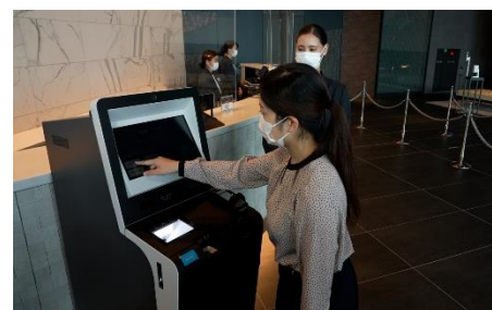
自動チェックイン機導入による接触軽減