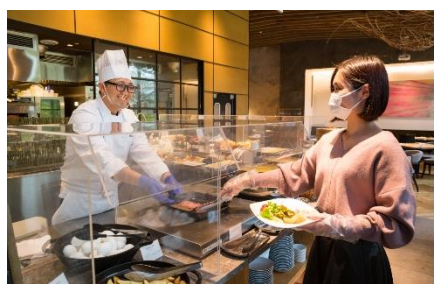
レストラン店内のアクリルボード設置とマスク・手袋着用徹底(ピュッフェ)