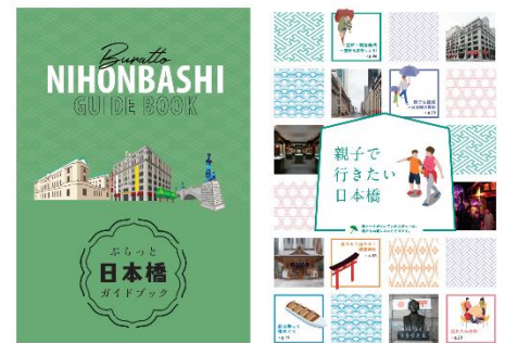
日本橋探究キット(日本橋探究ルートガイド)

日本橋探索の所要時間は時短ルートで 90 分程度ですが、チェックポイントをじっくり回っていただくことで半日以上かけて探索いただくこともできます。