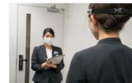
スタッフの体調管理の徹底

※対策の詳細はホテルの設備状況によって異なります。 ※施設によって、朝食ピュッフェの提供を停止しています。詳細は各ホテルのホームページをご確認ください。 ※画像はイメージです。