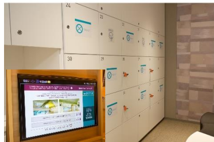
大浴場の利用制限と客室のテレビモニターで利用状況の確認