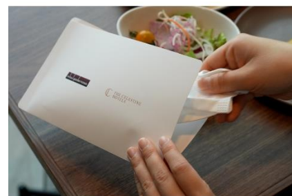
レストラン店内ではマスクケースをご用意