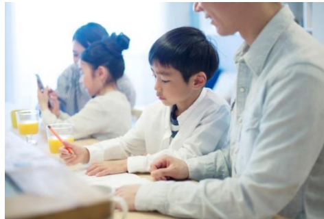
自由研究の作成の様子(イメージ)