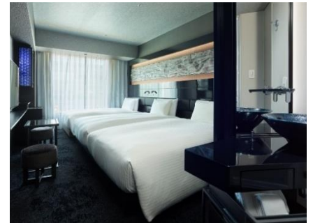
三井ガーデンホテル日本橋プレミア(客室)