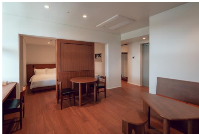
ホテル棟スイートルーム一例 (イメージ)