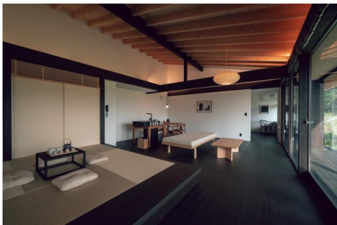
ヴィラ客室一例 (イメージ)