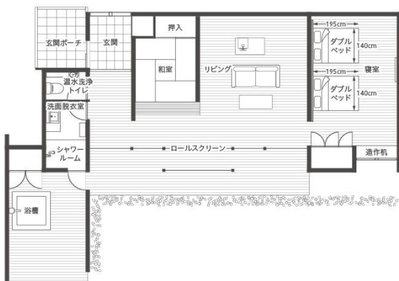
ヴィラ平面図 (イメージ)