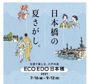
ECO EDO 日本橋 2021 メインビジュアル