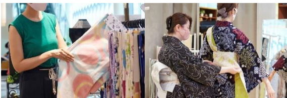
購入者は無料で着付けが受けられる

コレド日本橋 3F「いつ和」にて、浴衣の着付けが受けられます。購入者は無料で、持ち込みは 1,000 円 (税込) にて実施します。着崩れ直しにも対応。また、本サービスをご利用して、浴衣をご購入の方へマスクをつけた夏の街歩きにピッタリの「ビオレ冷タオル (5 本入り)」を先着 15 名様に、浴衣持ち込みの方へ「ビオレ冷シート」サンプルを先着 100 名様にプレゼントいたします。