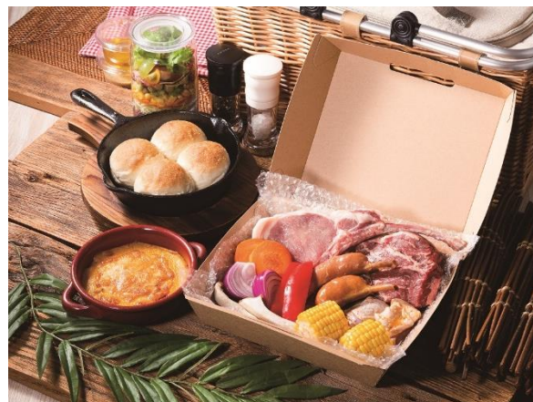
オプション(デラックスコース)