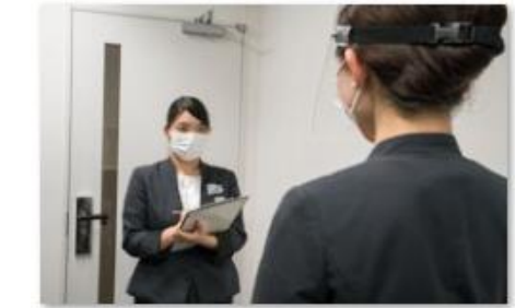
スタッフの体調管理の徹底