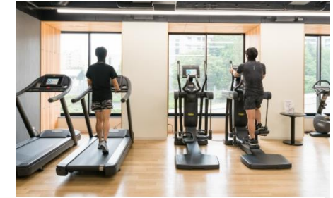
フィットネスなどパブリックスペースの人数制限と消毒の徹底