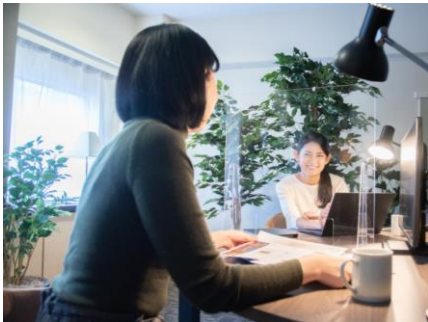
三井ガーデンホテル大阪淀屋橋