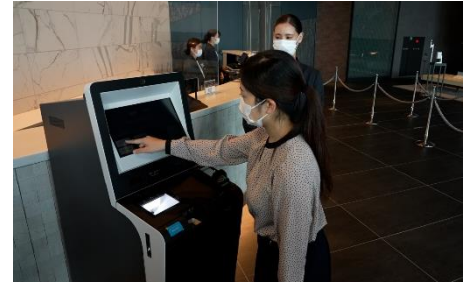
自動チェックイン機導入による接触軽減