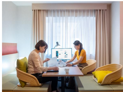
三井ガーデンホテル京都三条