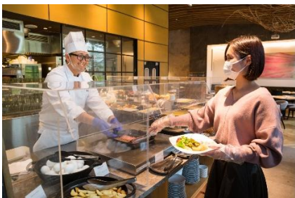
レストラン店内のアクリルボード設置とマスク・手袋着用の徹底(ビュッフェ)