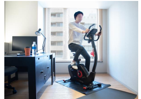
sequence KYOTO GOJO

ご予約期間 2021年9月30日(木)まで ご利用期間 2021年9月30日(木)まで ご利用時間 9:00～20:00(最大8時間)