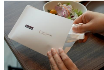
レストラン店内ではマスクケースをご用意