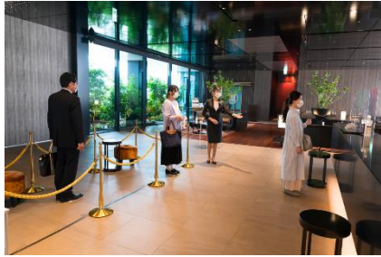
フィジカルディスタンスの確保