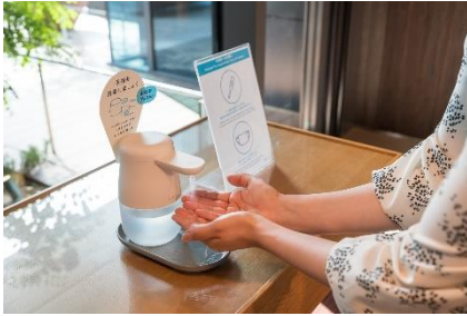
入館、館内施設利用時の検温と消毒