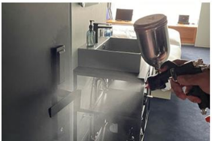
客室内の消毒と抗菌対策の徹底