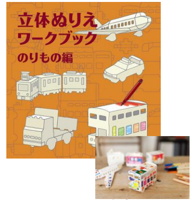
※販売商品イメージ