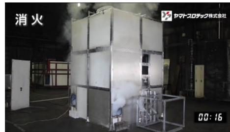
約 10 秒後に消火