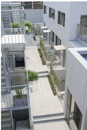
&lt;“通り庭”を中心に 2 棟を配置&gt;

京都の町屋に一般的な“通り庭”を 2 つの棟の間にデザインすることで、光や風の通り道としてはもちろん、限られたスペースを有効に使い、住人同士のゆるやかなつながりを生み出す場所を実現させました。さらに、その心地良さを住まいの中にも取り込めるように、それぞれの住戸には、大きな開口の窓やルーフトラスをデザインしました。隣家と壁を共有して連続的に建てられる低層住宅のタウンハウスだからこそ、大開口と開放感に溢れるゆとりの住環境が実現できました。