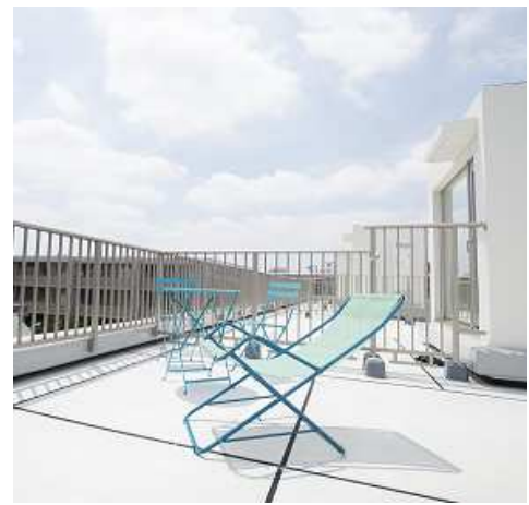
＜自邸の屋上を一人占めできるルーフテラス付きプラン＞