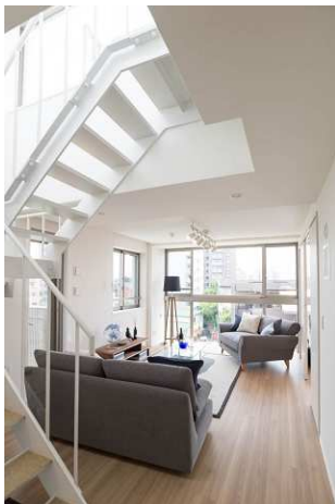
＜スキップフロアとルーフテラスのあるプラン＞

「スキップフロアとルーフテラスのあるプラン」「自邸の屋上を一人占めできるルーフテラス付きプラン」「吹き抜けを中心に3.5層の空間が緩やかにつながるプラン」など、自分らしい暮らしが描けるように27全戸異なるルームタイプをご用意しました。