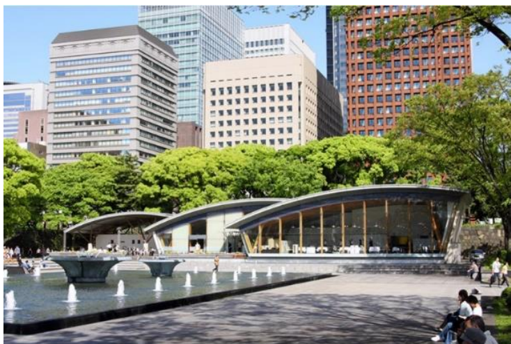
皇居外苑 和田倉休憩所

環境省が管理する国民公園の一つである皇居外苑の和田倉噴水公園内に立地する和田倉休憩所に、2021年12月、新たな店舗をオープンいたします。