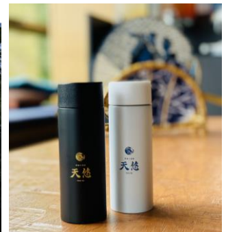
天悠ロゴ入りポケット