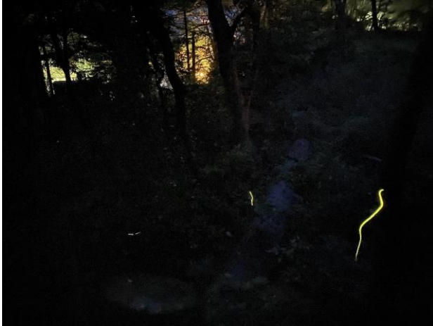
▲蓬萊園にて6月12日の風景