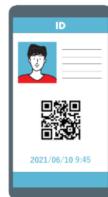
QRコードによる入退館(イメージ)