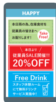
スタッフ特典・クーポン配信画面(イメージ)