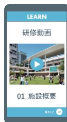
研修動画(イメージ)