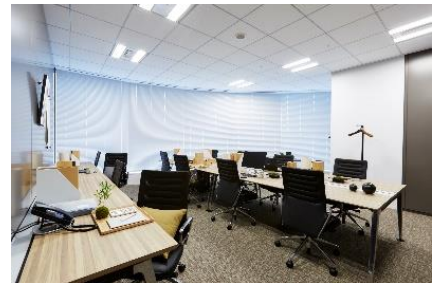
ワークスタイリング FLEX (ワークスタイリング東京ミッドタウン日比谷)

※ ワークスタイリング公式ホームページ: https://mf.workstyling.jp/