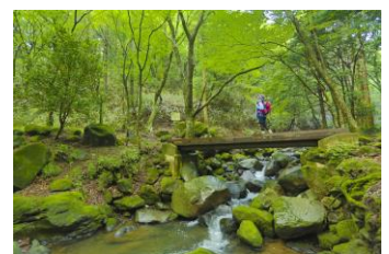
千条の滝ウォーキング