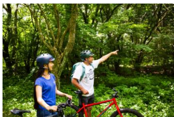
マウンテンリッパ