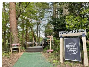
バーベキューガーデン