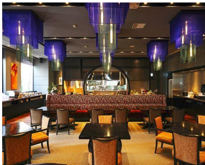
「Precious ONO HAKATA」店内

おすすめは身体をポカポカに温め、 エネルギー源にもなる「中華粥」と「餡掛け卵料理」。 ♫には、さっぱりとした「朝からめる麺料理」の“♫ラー”。 ブッフェ台にずらりと並んだ約50種類のお料理で、 ゆっくりとお過ごしください。