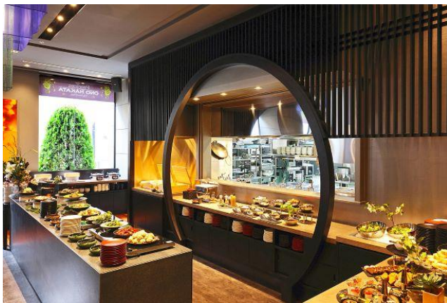
三井ガーデンホテル福岡中洲 「小野の離れ 博多本店」朝食