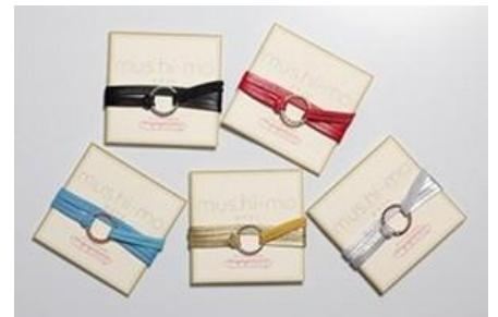
↑「mus. hi-mo (むすひも)」。5色のバリエーションがあり、それぞれ祓(はらい)を意味する森羅万象の「五行」と儒教の5つの道徳を掛け合わせた「五常」の意味合いが込められている。

※7月8日以降のブライダルフェア来館の方にも「mus. hi-mo (むすひも)」をプレゼントします