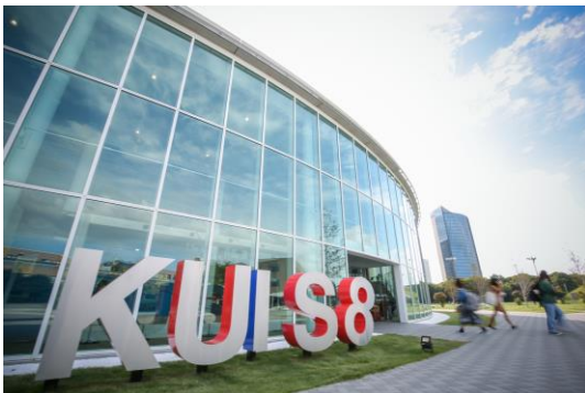
▲神田外語大学 8号館(通称:KUIS 8)外観

この度、本学が「Engagement(教育充実度)」において81.9ポイントと高い評価を受けた事を学長として誇りに思います。私どもは開学以来、教職員一丸となり、真の国際人を育成すべく、少人数教育にこだわり、歩みを進めて参りました。その積み上げた教育の取り組みに対する在學生や高校の先生方、そして本学から輩出された卒業生が社会で受ける評価の反映は、この上ない励みとなります。しかしながら、これからのAI社会に求められるサイエンスや数学の基礎教育の充実や、競争的資金獲得など、本学が取り組まなければならない課題は尽きません。この度の評価を真摯に受け止め、更なる拡充を目指し、地道な改革・改善に取り組む所存です。