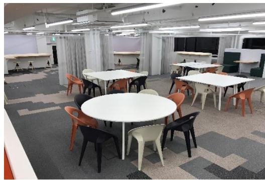
▲GLA Commons 内観

※本学から配信されるプレスリリースはSDGsに基づいた教育環境充実の一環として、UD(ユニバーサルデザイン)フォントで作成されています。