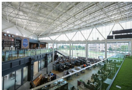
▲KUIS 8 内観