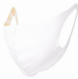
「フリーズテック 氷撃エチケットマスク」商品画像

マスク着用が習慣化した今、日常使いやスポーツ時、アウトドア時などのシーン別でマスクを使い分ける人も増えてきました。炎天下の中でのマスク着用は、口元が蒸れて息苦しかったり、汗とマスクで不快な状態になることも。そこで、 炎天下での運動時や外での作業時などに最適な「フリーズテック 氷撃マスク」 を発売いたします。