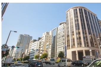
駅徒歩5分、60㎡の 築浅マンションを問い合わせ