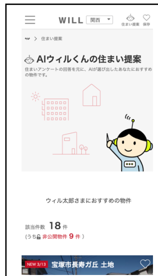
▲携帯電話でのサービスイメージ図

顧客が当社ホームページの無料会員登録後に回答するアンケートをもとに、AI ウィルくんがオススメ物件を提案。不動産情報は日々変化するため、毎日 1 度のペース（定休日を除く）で提案物件も更新されます。