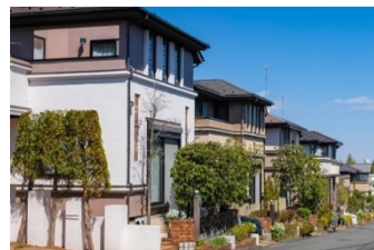
駅から徒歩15分、100㎡ 郊外の戸建を購入

夫婦 2 人家族の A さん（購入当時 32 歳）は、共働きのため通勤の便を最優先に考えて駅から徒歩 5 分以内のマンションの購入を検討し、ホームページから問い合わせ、内覧。しかしピンとこず、他の物件を数件見比べながらライフスタイルや今後の暮らしを考えた結果、駅から少し離れるものの自分たちの趣味を存分に楽しめるような広さの戸建てを購入しました。