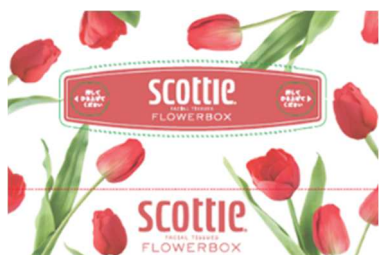
レッド:チューリップ 花言葉:愛の告白、真実の愛