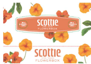
オレンジ:パンジー 花言葉:天真爛漫、楽しい