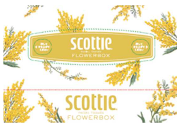
イエロー:ミモザ 花言葉:優雅、友情