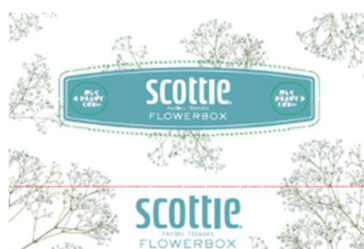
ブルー:かすみ草 花言葉:清らか、感謝