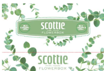
グリーン:ユーカリ 花言葉:新生、思い出