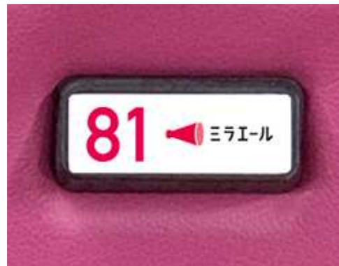
▲座席の席番イメージ

2020年12月から、ミラエールのサービスを福岡で新たに開始したことを記念し、「タカガールシート」のネーミングライツの契約締結をいたしました。ミラエールとは、当社が、14年にスタートした無期雇用派遣のサービスです。意欲の高い人材を当社にて無期で雇用し、オフィスワーク業務で派遣就業しながらキャリアプログラムに沿って派遣先企業と共同して活躍人材へ育成しています。20年11月時点で、4,800人以上がミラエール社員として全国で就業しています。