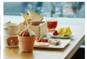
朝食券 利用イメージ