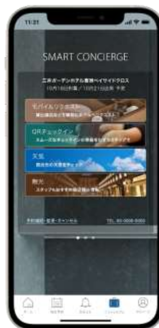
スマートコンシェルジュ