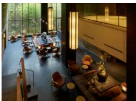
ホテル ザ セレスティン京都祇園