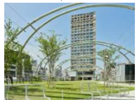
sequence MIYASHITA PARK