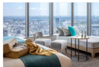
宿泊招待券 利用イメージ

また、sequenceにおいては、レイトチェックアウトは対象外となります。予めご了承ください。