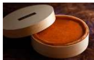
鳥羽国際ホテル オリジナルチーズケーキ