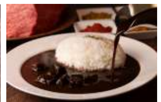
ホテルザセレスティン東京芝 オリジナルカレー