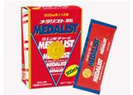
健康飲料メダリスト

クエン酸は食事で摂取した栄養分や体内に溜まった乳酸を活動のエネルギーに変えるとして現在、注目を浴びています。しかし、現代人の食生活ではクエン酸の摂取は難しく、多くの人に不足していると言われていました。アリストはそのクエン酸に注目。効率よく摂取できる健康飲料「メダリスト」を開発いたしました。メダリストはクエン酸をメインにビタミンB2、ビタミンC、カルシウム、マグネシウム、アミノ酸、カテキンなど40種類以上の栄養素を最適なバランスで配合。身体の内側から健康をサポートします。