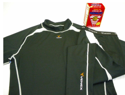
ギフトセット内容(イメージ)

ベネクスリカバリーウェアとメダリストを使用して、“内”と“外”2つの側面からアプローチを行うことで疲労回復をサポートする特別セットです。師走が近づき、一年間の溜まった疲れを感じるこの季節。疲労回復に特化した2つの製品で身体をリフレッシュしてみたいはいかがでしょうか。もちろん、11月23日(水)の勤労感謝の日やクリスマスギフトなど、年末の忙しさを迎えた大切な人へのプレゼントとしても最適です。