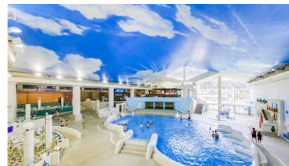
-箱根小涌園ユネッサン(神々のエーゲ海)-