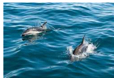
イルカと遭遇することも