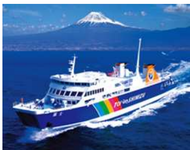
駿河湾フェリーと富士山