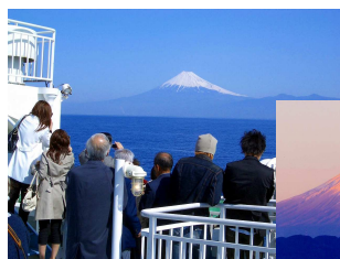
海越しに雄大な富士山を一望出来る