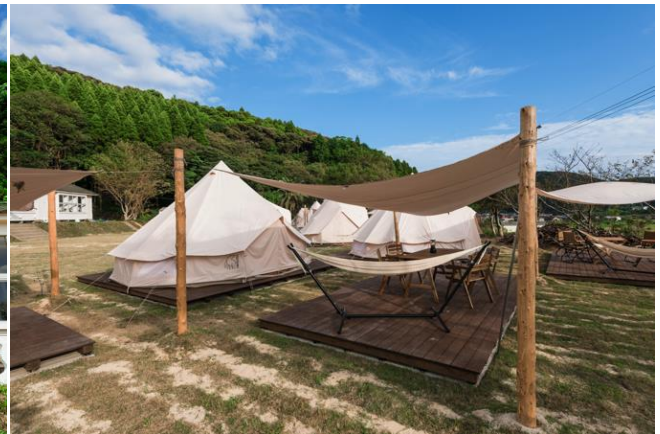
スクールハウス入口・テントデッキ