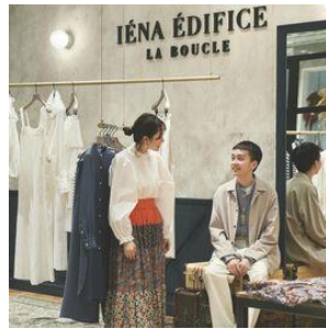
IÉNA ÉDIFICE LA BOUCLE