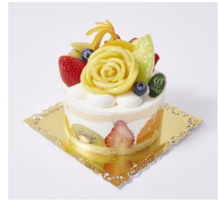
フルーツチュールタカノ