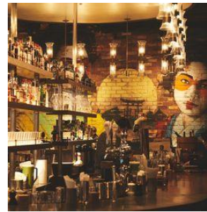
tavern on S <és>