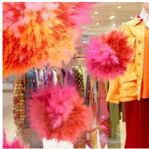
SUPER a MARKET

ニューマン新宿公式インスタグラムではニューマン新宿ならではの魅力をショップスタッフ、おすすめ商品、空間や装飾の 카테고리でご紹介。5周年を迎えるにあたって各ショップからの手書きのメッセージと合わせてお届け。まだ気がついていなかったショップの魅力を見つけてみてください。