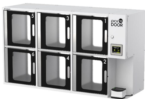
▲モバイルオーダー受け取りロッカー 「ピックアップドア」