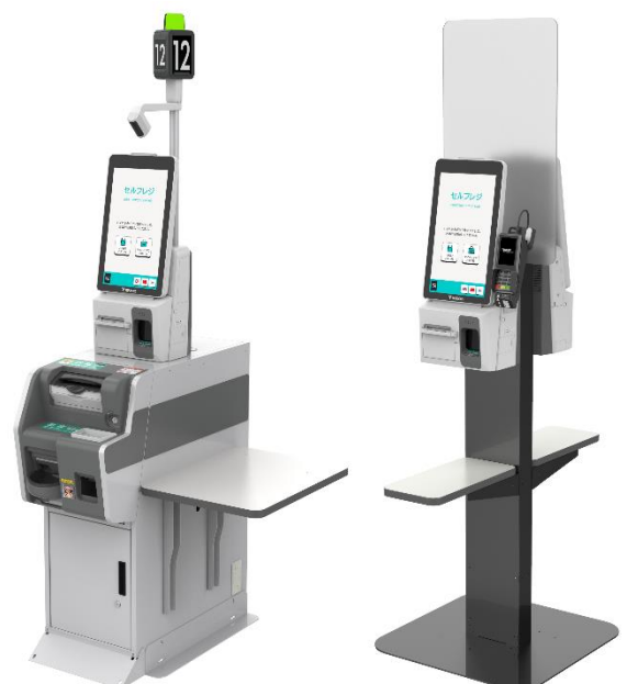
▲フルセルフレジ 「HappySelf (Generation3)」