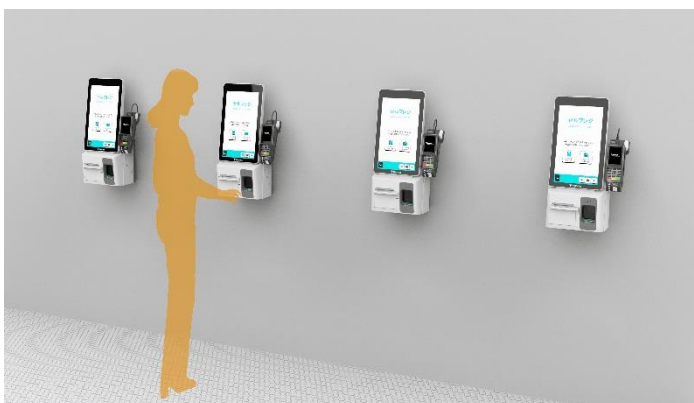
▲フルセルフレジ「HappySelf (Generation3)」 キャッシュレスタイプ (壁掛け設置例)

キャッシュレスの急増で高まるセルフレジ化ですが、現金支払いの継続が必要な店舗もあります。当社の「 キャッシュマネジメント 」は、セルフ精算機の現金在高の情報を集約し、売り上げ回収作業のスタート指示や、各セルフ精算機間での釣り銭枚数のコントロールを担います。今回の展示エリアでも、1人の従業員による効率よい店舗を再現します。