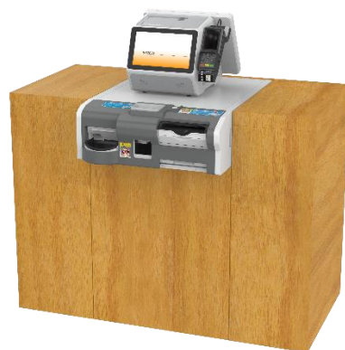
▲飲食店用セミセルフレジ「IPT2000」

この他に、流通、食品工業、物流、飲食の各産業向けに、新しい生活様式の一助となる製品をはじめ、最新の技術を活用したソリューションや各種クラウドサービス、環境製品などを展示します。