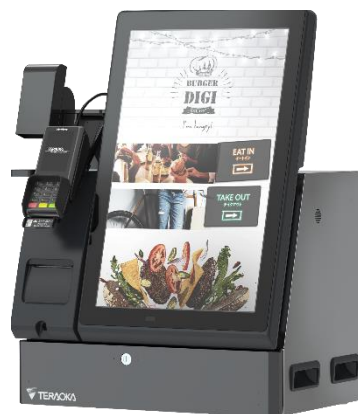
▲タッチパネル式券売機 「DeliousLio キャッシュレス」

そして、 新製品の前会計セミセルフレジ「IPT2000」 も展示します。本機種はお客様にお支払いをしていただくので、店舗従業員が現金に触れず、衛生面でもクリーンで安心、また、お客様と店舗従業員の対面時間も最小限にできます。