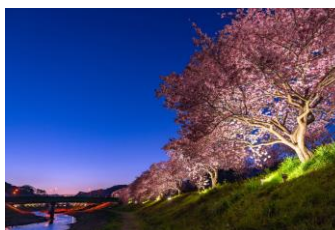
■夜桜ライトアップ