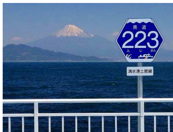
船上に設置された県道 223(ふじさん)標識