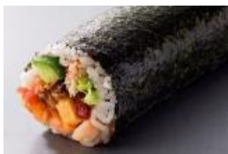
① 特選恵方巻 1,280円(税別)