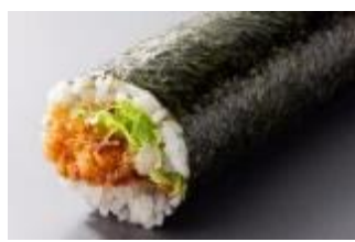
② 恵方かつ巻 980円(税別)