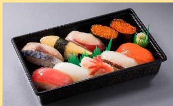
とんでん1人前 1,390円(税別)⇒ 1,251円(税別)