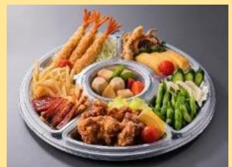
パーティーオードブル 3,000円(税別)⇒ 2,700円(税別)