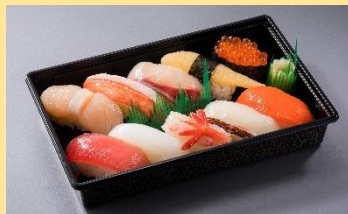
くしろ1人前 1,690円(税別)⇒ 1,521円(税別)