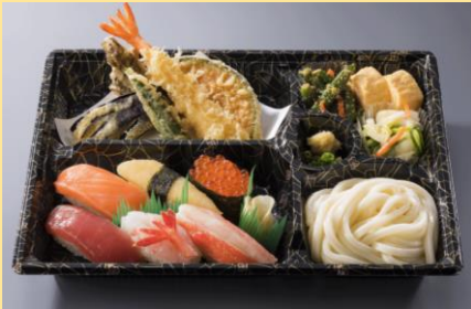
やまぶき 1,490円(税別)⇒ 1,341円(税別)

※岩槻店・鳩ヶ谷店・春日部緑町店・そが店・長津田みなみ台店では一部メニュー内容が異なります。