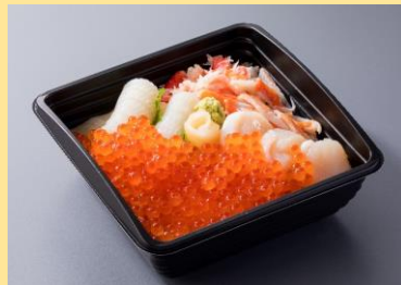
北海のっけ飯 2,990円(税別)⇒ 2,691円(税別)