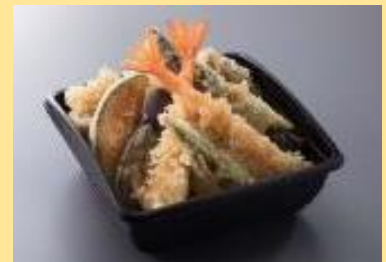
天丼 1,990円(税別) ⇒ 891円(税別)