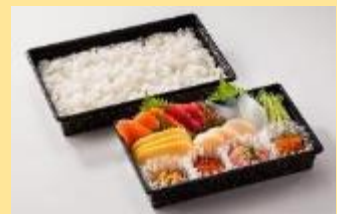
とんでん手巻きセット 1,990円(税別)⇒ 1,791円(税別)