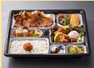
(左)北海道豚ロース焼き弁当/(右)さばの味噌煮弁当 1,200円(税別)⇒ 1,080円(税別)