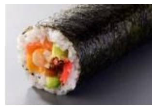
④ 恵方巻 880円(税別)