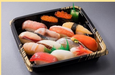
大漁鮨 1,690円(税別)⇒ 1,521円(税別)