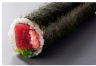
③ まぐろ贅沢恵方巻 1,380円(税別)