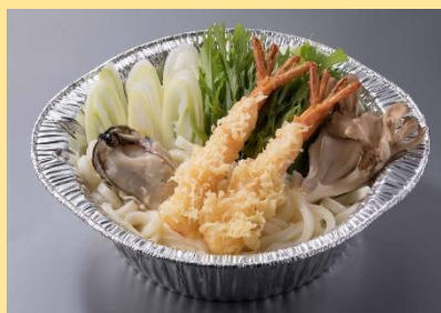
(右)えび天鍋焼きうどん 1人前 1,290円(税別)⇒ 1,161円(税別) ※鍋メニューは2月下旬までの販売を予定しています。