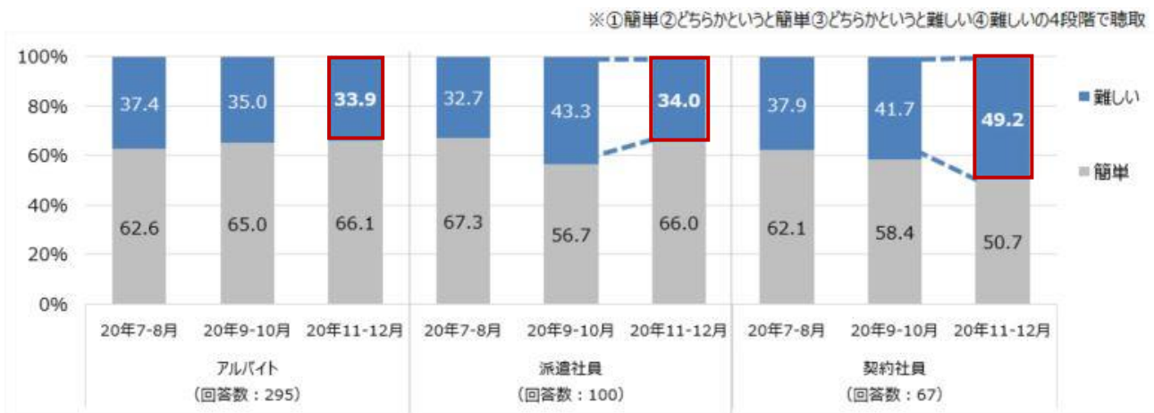
【図6】 非正規雇用（アルバイト、派遣社員、契約社員）の新規就業について