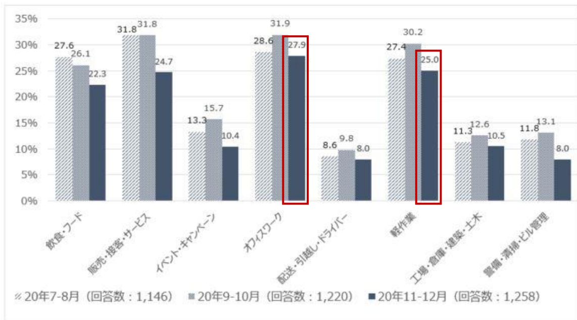
【図4】 非正規雇用の仕事探しをした理由