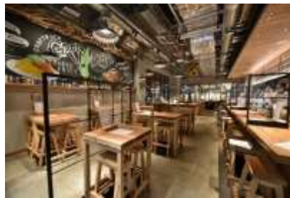
CRAFTROCK BREWPUB & LIVE (COREDO 室町テラス)