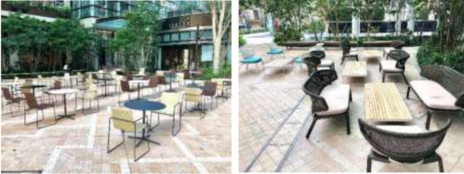
COREDO 室町テラス 大屋根広場