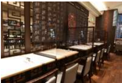
四川飯店 日本橋 ～Chen Kenichi's China～ (COREDO 室町 1)