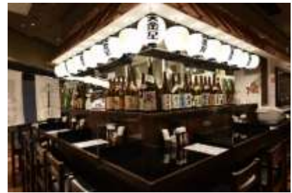
大金星 (COREDO 室町テラス)