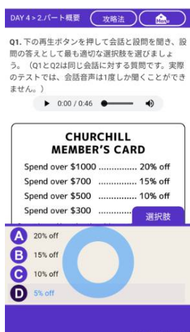
↑ パート概要 (例題)