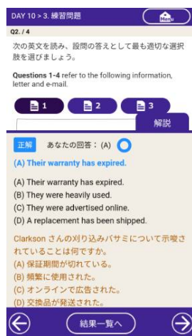
↑ 練習問題 (解説、採点結果)