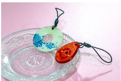
サードパーティ製の IC チップを使ったオリジナルキーの例