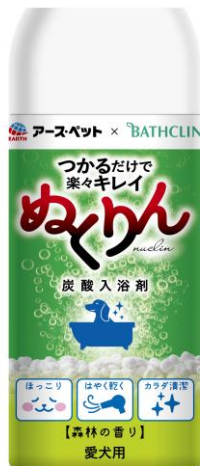
愛犬用炭酸入浴剤ぬくりん 森林の香り ボトル/分包

愛犬はお湯につかってほっこりいい気持ち、オーナーはとってもラクラク、愛犬の新しい入浴習慣をご提案します。