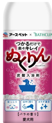
愛犬用炭酸入浴剤ぬくりん バラの香り ボトル/分包