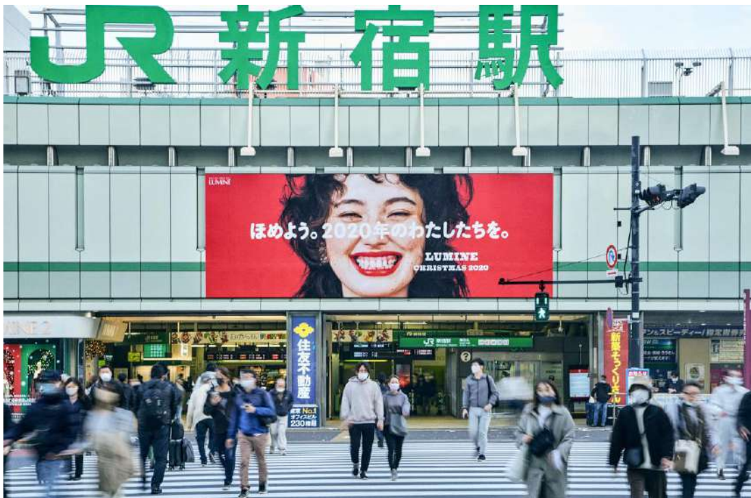
JR 東日本 新宿駅 大型ボード

11月17日（火）に公開した、2020年のルミネのクリスマスコンセプトやステートメント、総勢24名の女性たちが出演したスペシャルムービーなどをご覧いただいた方々から、「本当、今年のわたしたちを褒めてあげよう」「涙が出そうになった」「見つめ直すことがたくさんあった」「音楽もコンセプトと合っていて最高」など、多くの反響をお寄せいただいています。なかには、人目に留まる新宿駅の大型ボード掲出を前に足を止めて撮影される方の姿も見られます。1年を振り返りながら、今年のクリスマスの過ごし方に思いを巡らすひとときを、ルミネらしくご提案します。