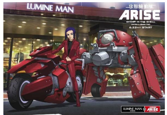
【プロダクション I.G によるオリジナルビジュアル】

そんな黄瀬和哉氏率いるプロダクション I.G に、今回のキャンペーンビジュアルのデザインを依頼。ルミネマン渋谷に劇場版登場キャラクターである「草薙素子」、「ロジコマ」が舞い降りる場面をイメージした、ルミネマン渋谷オリジナルビジュアルを制作いたしました。このビジュアルは、オリジナルノベルティや駅構内ポスターなどに使用されます。