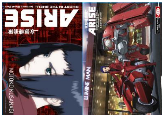
【クリアファイル: 草薙素子 ver.】

※1レシートあたりの購入金額に応じてのプレゼントとなり、レシート合算によるお引換は致しかねます。