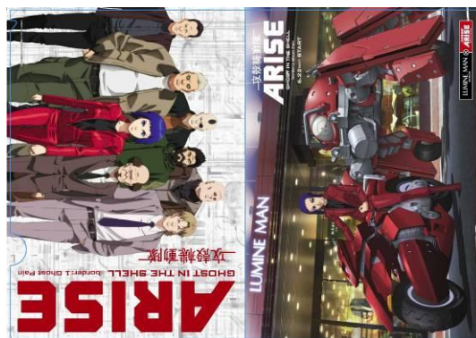
【クリアファイル: メインキャラクター全員集合 ver.】

©士郎正宗・Production I.G/講談社・「攻殻機動隊ARISE」製作委員会