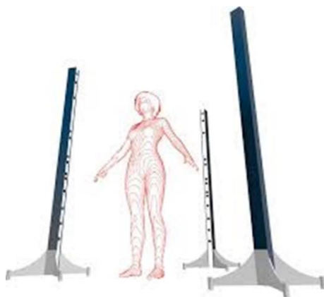
【3Dボディアスキャナーイメージ】