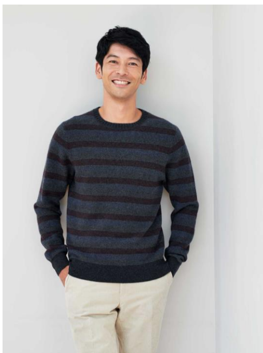
シャドーボーダークルーネックセーター 27,500円 (S・M・L) 28,600円 (LL)