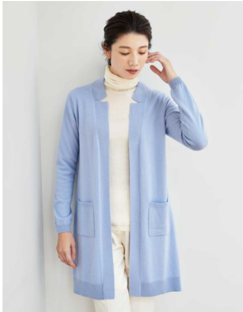
コーディガン 22,000円 (S・M・L) 23,100円 (LL)

テーラード調の襟デザインがきちんと感を演出するので、リモートスタイルやお出掛けにも活躍するマストバイアウターです。