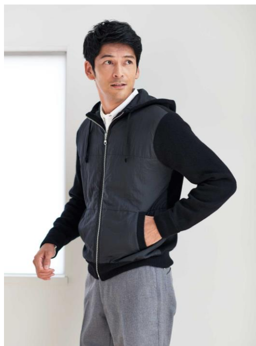
中わた入りフード付きアウター 39,600円 (S・M・L) 40,700円 (LL)