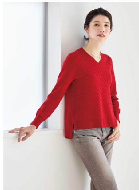
ダイヤ柄Vネックプルオーバー 16,500円 (S・M・L) 17,600円 (LL) 毎年大好評のVネックデザイン。ダイヤの編柄を加えたデザイン性の高い一着で、スカートはもちろんパンツにも合わせやすく、コーディネートの幅も広がります。

テーラード調の襟デザインがきちんと感を演出するので、リモートスタイルやお出掛けにも活躍するマストバイアウターです。