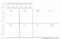
ミニクリアファイル