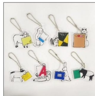
アクリルチャーム ※画像は 8 種のみ

※2 本商品はイベント限定の企画のため、通常、文具・小売店での販売をしておりません。