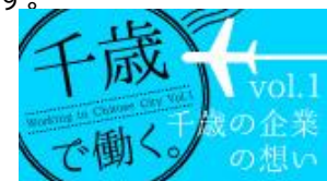
▲『はたらいく』TOP画面に掲載予定のバナー広告

地元企業の採用力の底上げを行うべく、オンライン採用支援セミナーを開催いたします。コロナ禍における現在の求人市場の動向についての最新情報をお伝えするとともに、採用HP作成支援ツール『ジョブオブLite』を活用した採用方法についてレクチャーいたします。長年アルバイト・パートや派遣、正社員領域全般を通して、求人メディアを運営してきたリクルートのノウハウが詰まったコンテンツでお送りいたします。