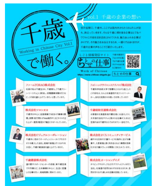
▲上段バナークリック後の千歳市内地元企業の紹介内容