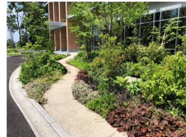
筑波研究所の新研究棟 住友林業緑化(株)が施工を担当