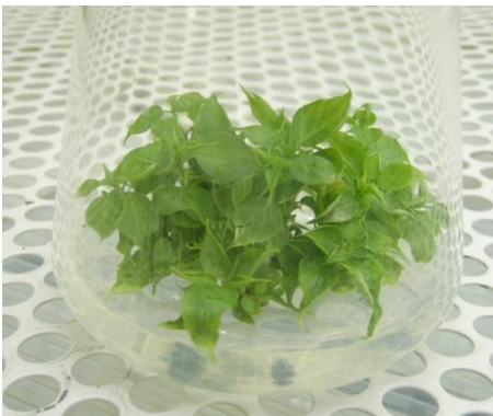
写真3 多芽体からの芽の伸長