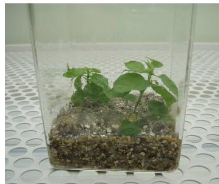
写真4 人工培土での発根