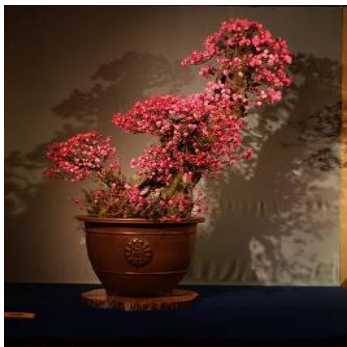
芙蓉峰 樹 齢:推定 350 年 高 さ:約 245 cm 直 径:約 60 cm