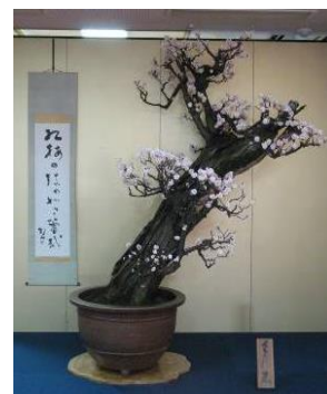
さざれ岩 ※3 樹 齢:推定 350 年 高 さ:約 275 cm 直 径:約 55 cm

※3 現在枝ぶりを整えるため盆梅管理場に植え戻しており、来年の盆梅展で展示はありません。