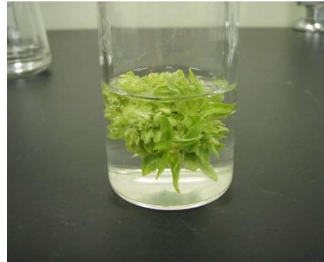
写真2 茎頂から誘導した多芽体