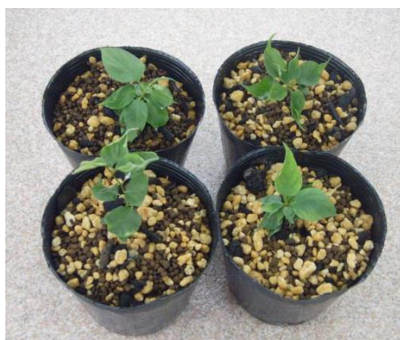
写真5 屋外での順化

なお、住友林業は増殖した苗が確実に同じ形質(花や葉など)を受け継いでいるか確認するため、形態観察に加え遺伝子鑑定をしています。