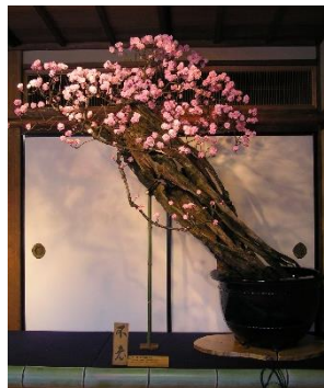
不老 樹 齢:推定 400 年 高 さ:約 240cm 直 径:約 60 cm