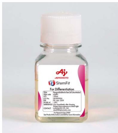
図2 開発した臨床向け分化誘導用分化サプリメントの StemFit® For Differentiation