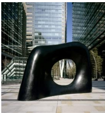
▲ 妙夢(安田 侃)

このアートプロジェクトでは、計画の当初からアートディレクターとアーティスト、施主、建築家、ランドスケープアーキテクト、インテリアデザイナーなど全ての関係者との緊密なコラボレーションによって計画が進められました。その結果、アートが建築と一体化し、さらには街や庭園の機能とも調和したアート環境を実現。アート作品はそれぞれがその場所において機能を持ち、都市空間を演出しています。