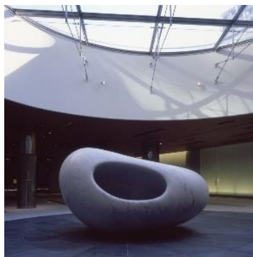
▲ 意心帰(安田 侃)