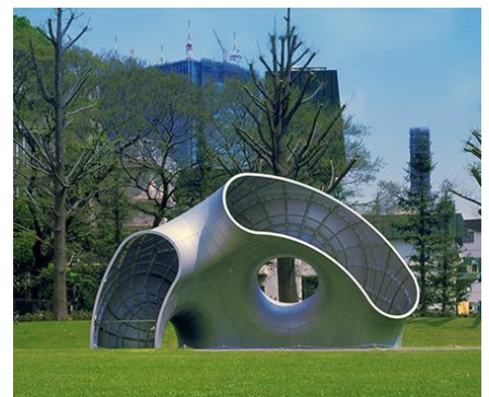
▲ フラグメント No.5 (フロリアン・クラール)