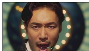
(Cho : シーバ®♪) ・Title:シーバ®♪