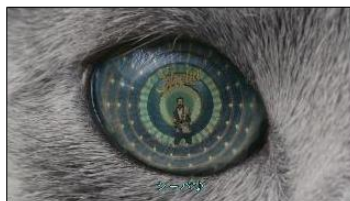
(Cho : シーバ®♪) ・Title:シーバ®♪