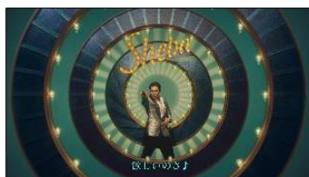
(VO) 欲しいのさ♪ ・Title:欲しいのさ♪