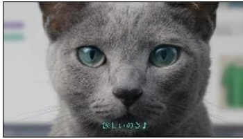
(VO) 欲しいのさ♪ ・Title:欲しいのさ♪