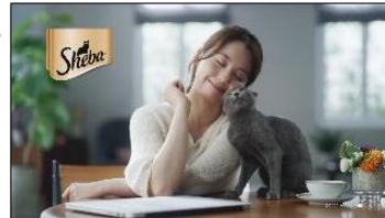
・Title : © 2020 Mars or Affiliates. ・CI