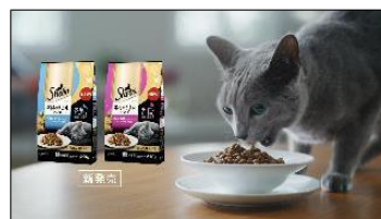
・Title:新発売 ・Product: Delight